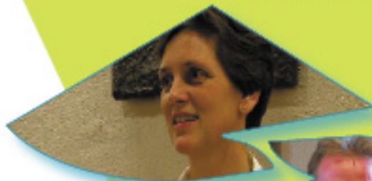
Tjitske Kuiper - de Haan Fractievoorzitter & Lijsttrekker